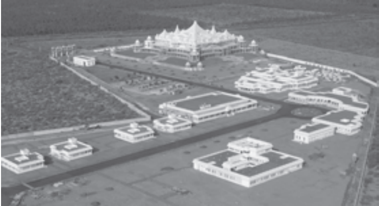
Die Oneness University